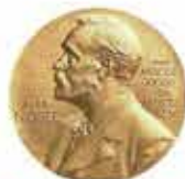
1996年フラレーンの発見者にノーベル化学賞が贈られました。