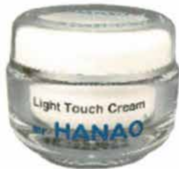
mister HANAO クリーム 定価 6,450円(税別) / 容量 50g