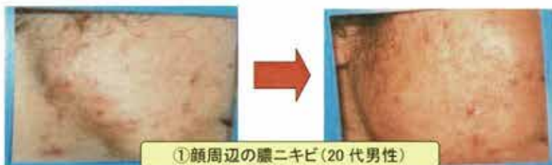
①顔周辺の膿ニキビ(20代男性)

ニキビや吹出物の原因にマルチにアプローチ。皮脂の過剰分泌を抑制し、毛穴のコメドを溶解。アクネ菌を抑制しつつ、炎症を抑えてくれます。