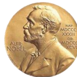
1996年フラレーンの発見者にノーベル化学賞が贈られました。