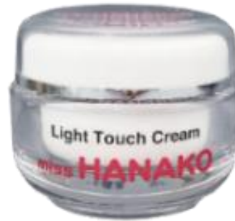
miss HANAKO クリーム 定価 5,950円(税別) / 容量30g