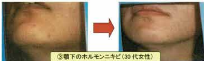
③顎下のホルモンニキビ(30代女性)

ニキビや吹出物の原因にマルチにアプローチ。皮脂の過剰分泌を抑制し、毛穴のコメドを溶解。アクネ菌を抑制しつつ、炎症を抑えてくれます。