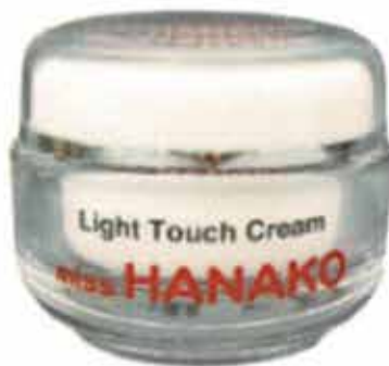
miss HANAKO クリーム 定価 6,450円(税別) / 容量50g