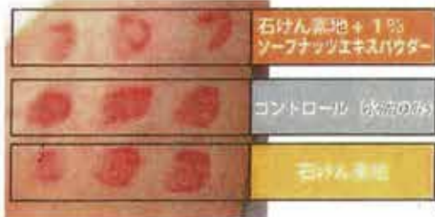
ソープナッツエキスパウダーの口紅に対する洗浄作用

※オーガニック由来なのに、メイクも落とせる洗浄力※ 優しい泡立ちで洗い上がりはしっとり。抗酸化、油性肌、敏感肌の方に特にオススメ。さらに赤ちゃんのお肌にも使えます。