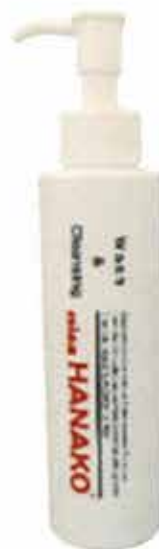
miss HANAKO クレンジング&ウォッシュ 定価 4,980円(税別) / 容量 150ml