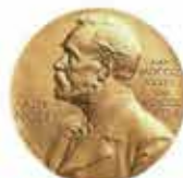
1996年フラレーンの発見者に ノーベル化学賞が贈られました。

※肌状態をコントロールし、常在菌が健康な肌を作る※ 皮膚常在菌のバランス調整剤。外部からの刺激により、乱れた皮膚バランスを回復させ、健康な肌に存在する常在菌を活性化します。